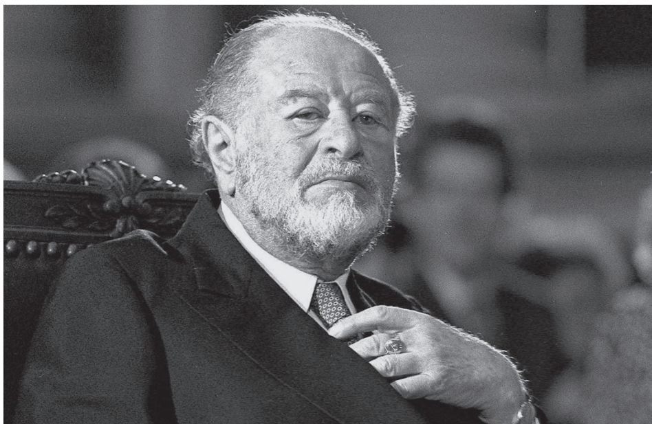
Bruno Kreisky war eine politische Ausnahmeerscheinung.

Vera Vieider. Am Hafen: Edition Laurin 2010, 84 S., 15,90 €.