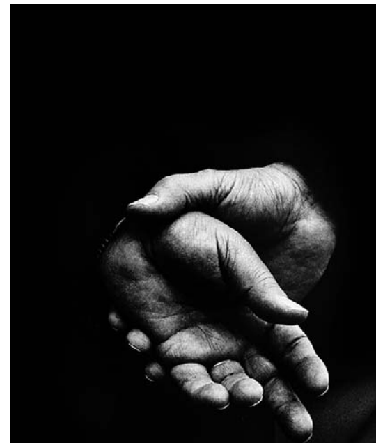
13 Jahre lang hielt Bruno Kreisky die Macht in Händen. Im Juli 1990 starb der Altkanzler