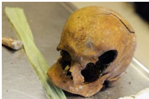
LEICHENSÄCKE. Die Überreste der Opfer von Srebrenica werden im Kühlraum auf zehn Ebenen geschichtet.