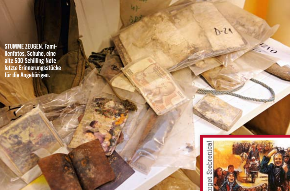
STUMME ZEUGEN. Familienfotos, Schuhe, eine alte 500-Schilling-Note – letzte Erinnerungsstücke für die Angehörigen.