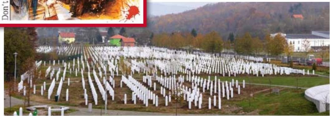
DAS GRÄBERFELD VON SREBRENICA. Gerade einmal die Hälfte der 8.000 Opfer ist identifiziert und beigesetzt.