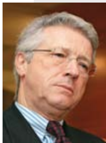
WOLFGANG PETRITSCH. Der Bosnien-Experte.