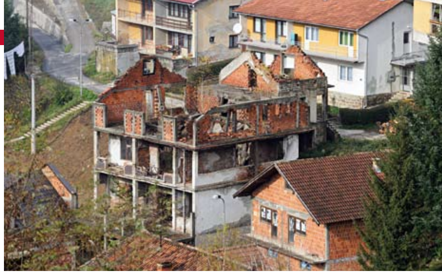
RUINEN-STADT. Das Zentrum von Srebrenica, 14 Jahre nach Kriegsende. Ein Gutteil der vertriebenen Bosnier kehrte aus Angst vor Vergeltung nie mehr in die Heimat zurück.

BOSNIEN - UND DIE ROLLE EUROPAS? Petritsch spricht von „europäischer Ignoranz“: „Das Interesse hat sich völlig abgewendet – aber wenn wir nicht einmal die Probleme auf dem Balkan lösen können, brauchen wir es in Afghanistan gar nicht erst zu versuchen.“