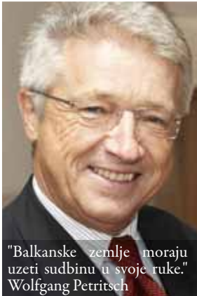
"Balkanske zemlje moraju uzeti sudbinu u svoje ruke." Wolfgang Petritsch

šeg kancelara Gusenbauera trebala je biti opreznija. Sadašnje Ahtisaarijevo rješenje