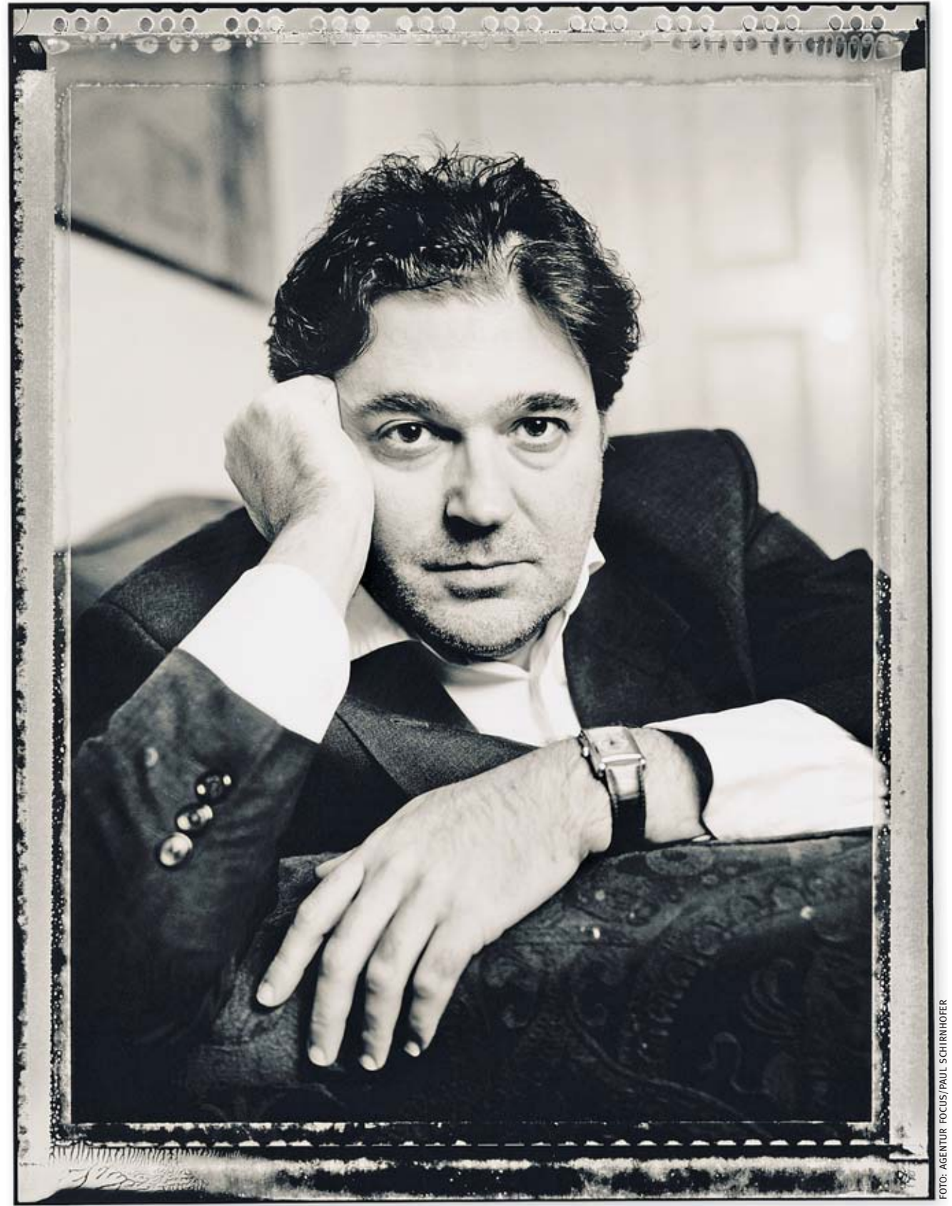
Leon de Winters neues Buch ist mehr als ein Roman. Es ist die Ankündigung eines Unheils. Sagt Henryk M. Broder

1948 waren es etwa 800 000 Flüchtlinge, heute sind es mehr als vier Millionen, weil auch die Kinder und Enkel der Entwurzelten von 1948 auf ihr Recht auf Rückkehr nicht verzichten wollen. „Solange Israel die Verantwortung als Verursacher der palästinensischen Flüchtlingssituation von sich weist und sich weigert, die Rechte der Flüchtlinge anzuerkennen, wird es im Nahen Osten keinen dauerhaften Frieden geben“, heißt es zum Beispiel auf der Homepage der Deutschen Muslim-Liga. „Das Recht auf Rückkehr“ sei eine „Voraussetzung für den Frieden“ im Nahen Osten. Die dritte Bedeutung, die der Formel „Recht auf