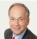
VON RUDOLF TASCHNER