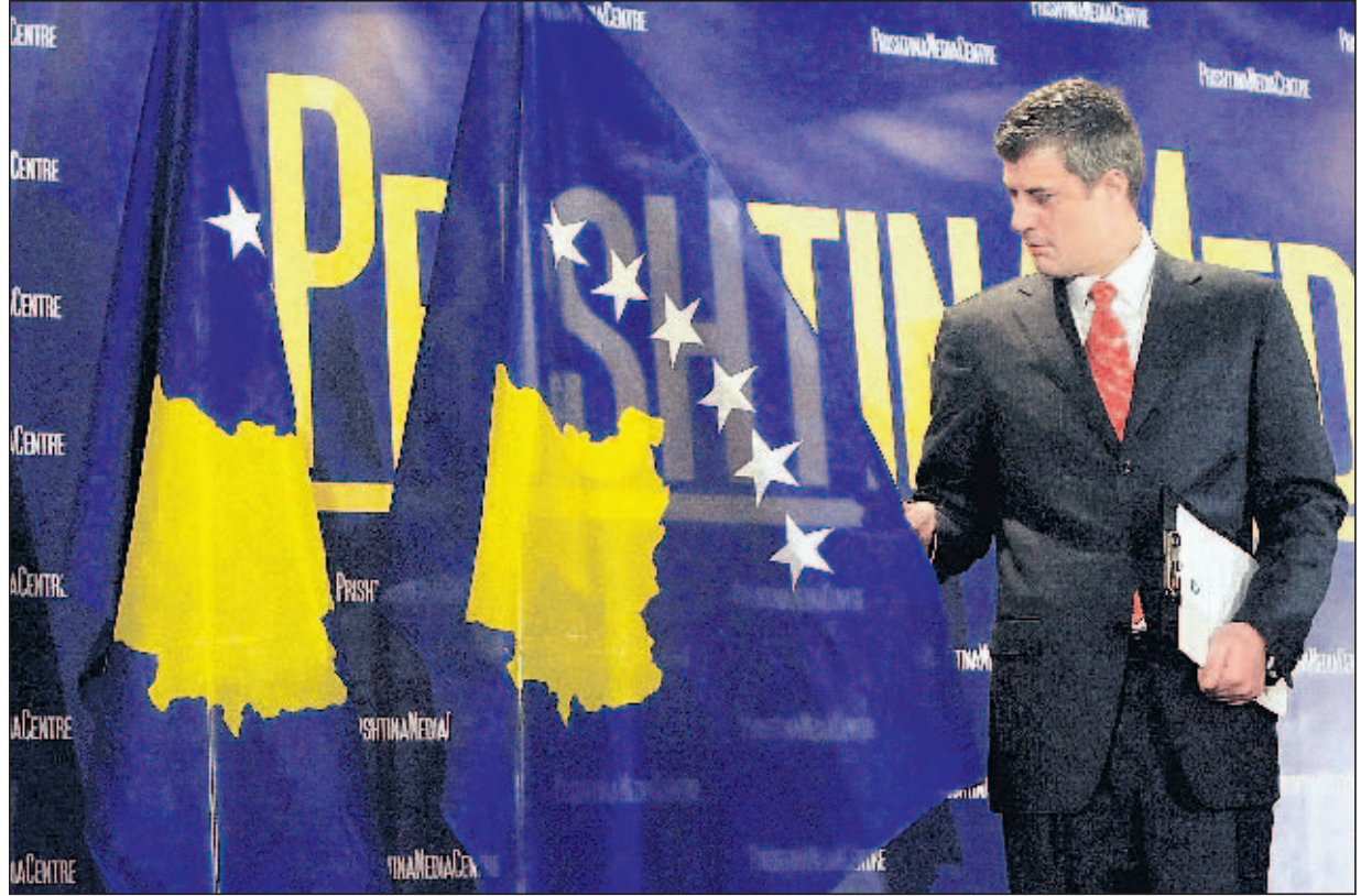
Mit neuer Fahne der EU näherrücken: Premier Hashim Thaçi prüft das Symbol der Unabhängigkeit.

Das kürzlich neubelebte Mitteleuropäische Freihandelsabkommen (Cefta) soll zum regionalen Hauptantriebsmotor für Handel und Wirt-