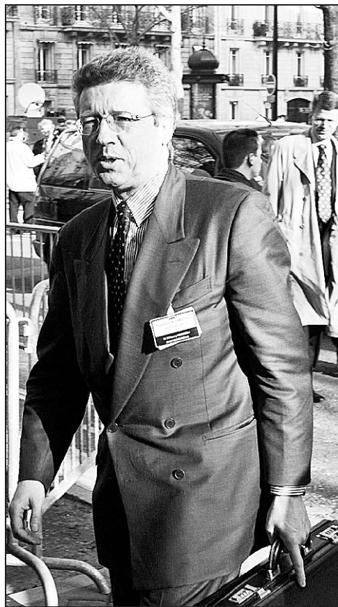
Sieht zwischen dem Irak und dem Kosovo-Konflikt nur „begrenzte“ Parallelen: Wolfgang Petritsch, hier bei seiner Ankunft in Paris/Rambouillet im Winter 1999.

Milošević hat damit eigenhändig und kalkuliert eine friedliche Lösung torpediert und den Krieg bewusst in Kauf genommen. Saddam