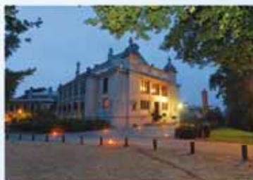
La Bibliothèque Solvay, Quartier général de FoE