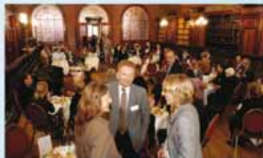
Informalité des déjeuners-débat Café Crossfire