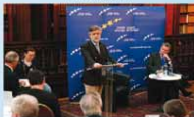
Un Policy Spotlight autour d'une personnalité européenne