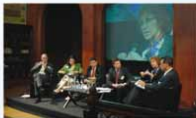
Le dynamisme de nos conférences « European Policy Summit »

Pour plus d'informations, ou pour recevoir notre newsletter: www.friendsofeurope.org