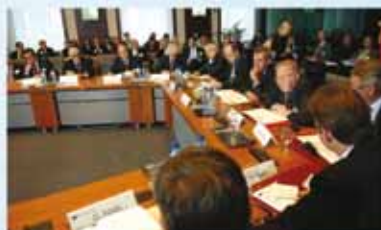
Echange entre personnalités lors d'une table ronde