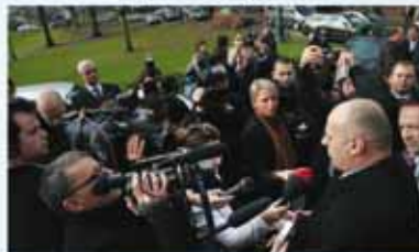
Active participation des médias